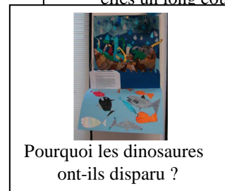
Pourquoi les dinosaures ont-ils disparu ?

Au mois de Décembre, chaque élève a donné son maximum afin de finir les 2000 ou 2200 m qu'il avait à parcourir lors du CROSS organisé à Ladornac.