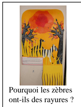
Pourquoi les zèbres ont-ils des rayures ?