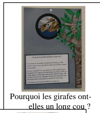
Pourquoi les girafes ont-elles un long cou ?